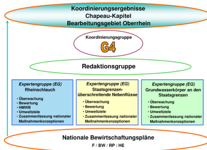
Abb. 1 Organisation der grenzüberschreitenden Koordination im BG Oberrhein

Der Staats- und Landesgrenzen überschreitende Erarbeitungsprozess des Chapeau-Kapitels für das BG Oberrhein wird durch nachfolgende Grafik veranschaulicht.